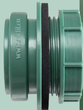
Aanschroefmof DN 50 - groen