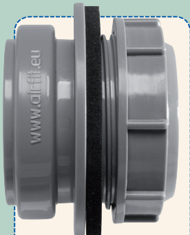
Aanschroefmof DN 50 - grijs

Airfit Aanschroefmof DN 50 voor de aansluiting achteraf van HT-reinigingsinstallaties vanaf DN 75 in oplopende lijn, voor de toevoer van afvalwaters uit brandweergereedschap, spoelen, wasmachines, enz.